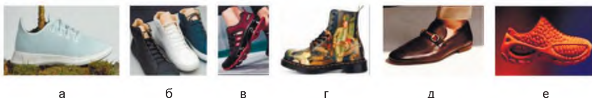
Рисунок 2 – Современные тенденции в обуви:

Универсальность. Модели, которые можно носить в разных ситуациях – от работы до отдыха, становятся все более популярными. Эти тенденции показывают, как мода на обувь адаптируется к современным требованиям и предпочтениям потребителей. На основе параметров, выявленных выше, генерируются эскизы в чате GPT «Kandinsky» [6, 7]. Боту нужны максимально подробные запросы, поэтому писались они в стиле «Создай коллекцию обуви на платформе, вдохновением для которой являются узбекские музыкальные инструменты. Используй текстуру дерева, различные вырезы, а также желтый, коричневый и бежевый цвета».