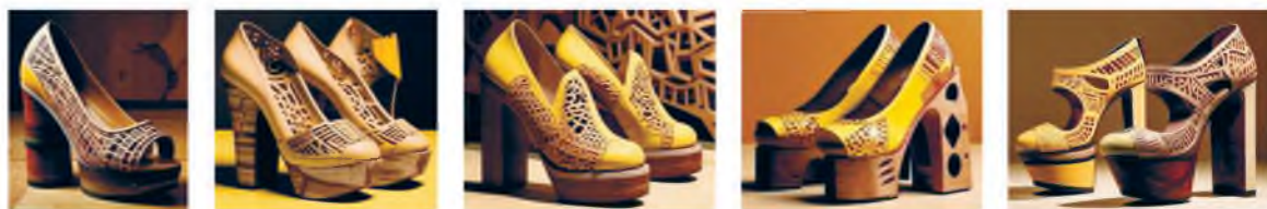
Рисунок 3 – Сгенерированные модели обуви

любят комфорт и сочетание традиционности и современности. Исходя из вышеперечисленного была разработана авторская эскизная коллекция (рис. 4).