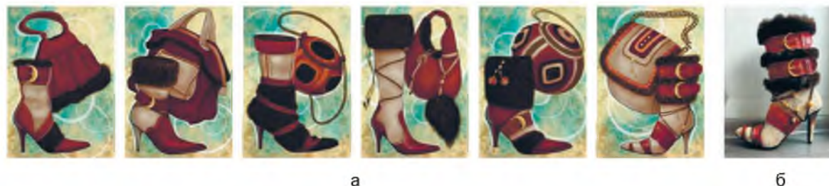
Рисунок 3 – Авторская коллекция Орловой Елизаветы: а – эскизы; б – макет

Полученные изображения использованы как основа для создания эскизов. Коллекция будет включать в себя обувь и аксессуары, вдохновленные национальным костюмом, обувью и орнаментом эскимосов. Основной цветовой палитрой выбраны красно-коричневые, винные и бежевые цвета. В качестве материалов будут использованы кожа и мех, и большое количество фурнитуры – ремешки, шнурки, различные элементы обмотки, бляшки. Проведенный анализ современных трендов и идей, полученных от нейросетей, явились ориентиром в процессе разработки авторских эскизов. Эскизы включают сапоги и полусапоги в комбинации с сумками, разработаны согласно выбранной цветовой гаммы. В моделях использовано много фурнитуры: ремней, бляшек, шнурков (рис. 3 а). Итогом работы явился макет, выполненный методом папье-маше, также использована самозастывающая глина, мешковина, ткань, шнурки, искусственный мех и фурнитура. Макет получился цельным и полностью отражает модель эскиза (рис. 3 б).