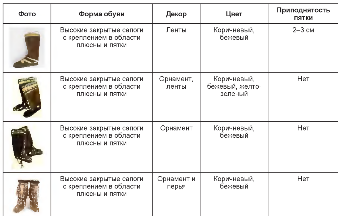
Таблица 1 – Сравнительная таблица национальной эскимосской обуви

традиционным орнаментом. У мужчин – это кружки в уголках рта. У женщин – линии на лбу, носу, подбородке. На щеки наносили более сложный узор. Татуировали и кисти рук, и предплечья. На основе проведенного анализа получены диаграммы, из которых выявлено, что основной обувью эскимосов являются сапоги коричневого и бежевого цвета с национальным орнаментом эскимосов без каблука с креплением в области плюсны. Крепление на ноге достигается с помощью ремешков и шнурков. Кроме того, незаменимым элементом обуви эскимосов является мех, это обусловлено суровым климатом региона (рис. 2).