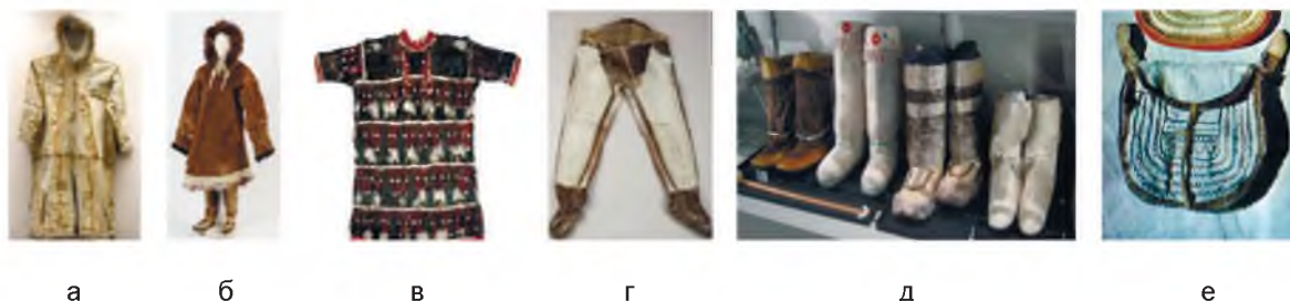
Рисунок 1 – Элементы одежды традиционного костюма эскимосов: а – кухлянка, б – камлейка; в – тимьяк; г – меховой комбинезон к'алъывагын; д – торбаса; е – сумка

Эскимосы активно декорировали не только одежду. В старину они и лица украшали моржовыми зубами, костяными кольцами и стеклянными бусинами, протыкая перегородку носа или нижнюю губу. До нашего времени распространена у эскимосов татуировка, и тоже с