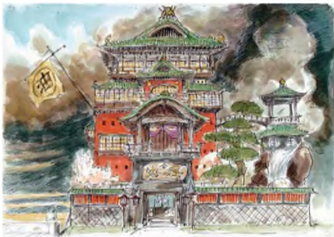
Рисунок 1 – Иллюстрация Хаяо Миядзаки к фильму «Унесённые призраками» (2001 г.). Акварель, бумага

части в общую тень. Мягкие тонкие переходы в акварели позволяют применять прием выбора цвета с влажной поверхности бумаги полусухой отжатой кистью [2].