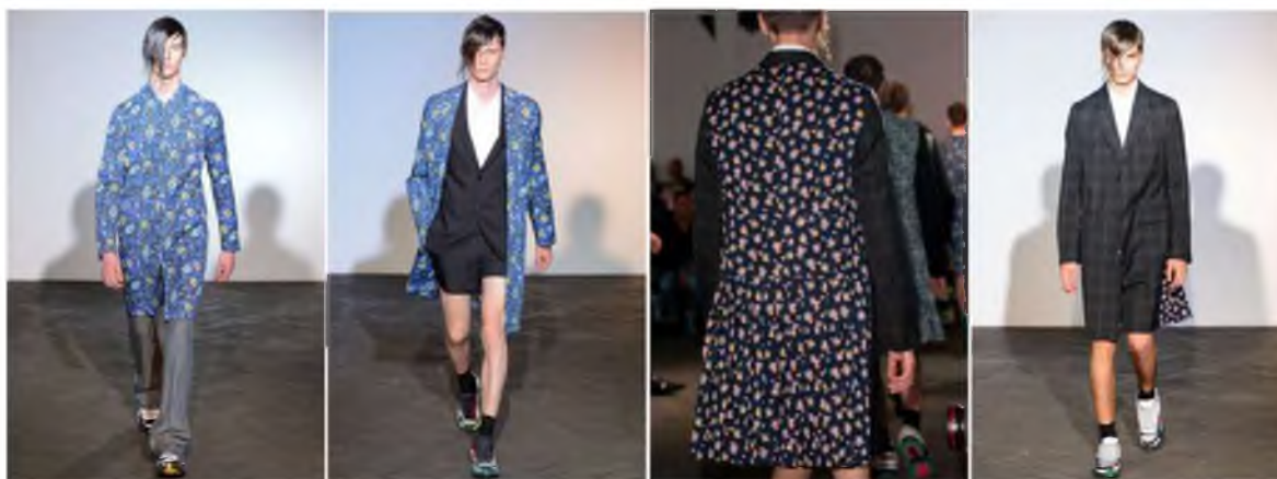
Рисунок 3 – Образы из коллекции Raf Simons весна-лето 2013

Коллекция сезона весна-лето 2013 демонстрирует эволюцию творческого метода дизайнера, который сохраняет тонкие визуальные отсылки к музыкальной культуре, но переходит к более сдержанным формам и стилистическим решениям (рис 3). Одним из ключевых элементов коллекции становится деконструкция гендерных стереотипов. Культовый снимок Курта Кобейна для издания «The Face» показывает музыканта в платье с цветочным принтом, что подразумевает вызов, отказ от гендерных стереотипов, контраст мягкости и грубости, присущие стилю гранж [2]. Этот нарратив Симонс тонко вплетает в классический предмет мужского гардероба – строгое пальто: при фронтальном восприятии модель выглядит сдержанно, однако при повороте открывается цветочный принт на спине. Подобный прием создает эффект неожиданности и подчеркивает идею двойственности. Рассуждения на тему хрупкости, юности, андрогинности проявляются в таких элементах одежды и приемах, как сочетание классических костюмов с короткими шортами; использование топов-туник и пастельных оттенков; интеграция кроссовок в формальные ансамбли; принты с работами художника Брайана Кэлвина, изображающие гипертрофированные лица.