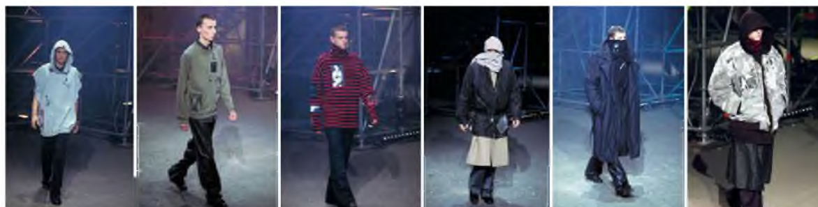
Рисунок 1 – Образы из коллекции Raf Simons осень-зима 2001 «Riot Riot Riot»

что усилило атмосферу маргинальности. Цветовая гамма – темная, не просто приглушенная, а скорее тусклая, с вкраплениями бордового и серо-голубого, что визуально коррелирует с эстетикой музыкальных направлений панка и гранжа. Стилистика коллекции отсылает к субкультурной молодежи, выражающей протест против формализованных норм общественного дресс-кода. Ключевым элементом, формирующим нарратив коллекции, становится стайлинг: многослойность и намеренная деформация силуэтов создают эффект «кокона», интерпретируемого как метафора защиты от внешнего мира. Визуальные маркеры панк-эстетики включают деконструированные элементы одежды – худи с отрезанными рукавами, свитшоты с искусственными повреждениями ткани, а также тельняшки с аппликациями.