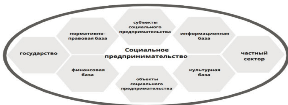
Рисунок 1. Экосистема социального предпринимательства

На рисунке 1 представлена экосистема социального предпринимательства, каждый элемент которой вносит важный вклад в ее развитие и повышает эффективность функционирования субъектов социального предпринимательства.