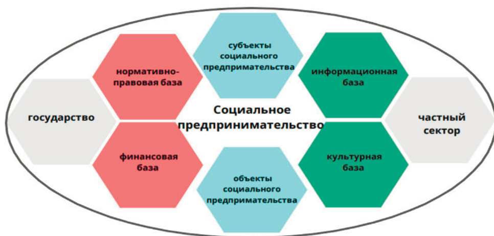
Рисунок 3. Экосистема социального предпринимательства в Республике Беларусь

На рисунке 3 представим экосистему социального предпринимательства в Республике Беларусь с цветовым отражением уровня развития его отдельных элементов (зеленый – достаточно развит, голубой – имеются определенные регулирующие инструменты, красный – не регулируется, не развит).