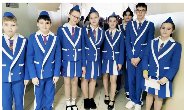
Авторская коллекция Н. Захарчука, созданная по заказу гимназии №5 г. Витебска