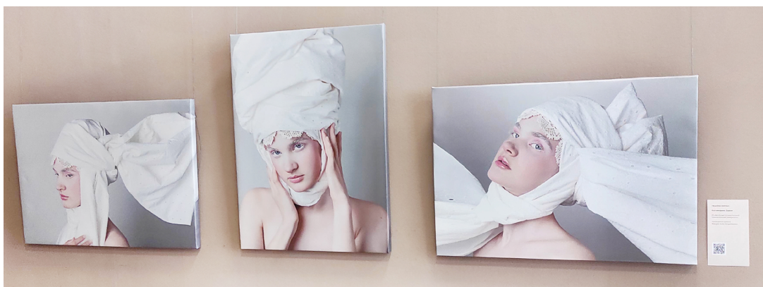
Работы победителя номинации «Фото» Д. Наговицыной