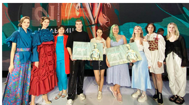
Финалисты конкурса «Мельница моды 2023»

«Дебют'22» из 52 образов студентов нашего факультета специальности «Дизайн костюма и тканей» стал самым масштабным за всю историю проекта.