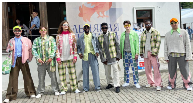
Коллекция «Красавчики», Н. Захарчук