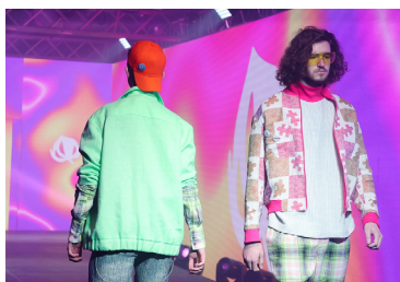
Промышленная коллекция «Youngsters», Н. Захарчук