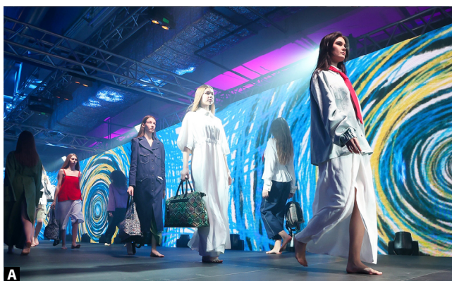
Промышленные коллекции: а – «19:30 Перевоплощение SS'23», б – «Петрикор», К. Урбан