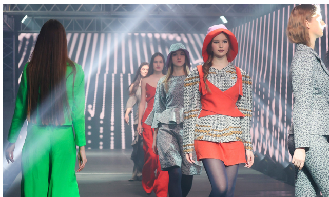
Сборная промышленная коллекция студентов факультета дизайна из льносодержащих тканей

Основная задача факультета – активное вовлечение студента в профессию, начиная с первых курсов. Наиболее ярко это реализовано для специальности «Дизайн костюма и текстиля». В студенческой дизайн-студии разрабатываются коллекции