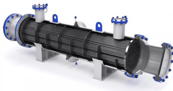
Рисунок 1 – Кожухотрубчатый теплообменный аппарат

В программе обучения будущих инженеров-энергетиков, в рамках учебной дисциплины «Тепломассообмен», производится проектирование кожухотрубчатого теплообменного аппарата.