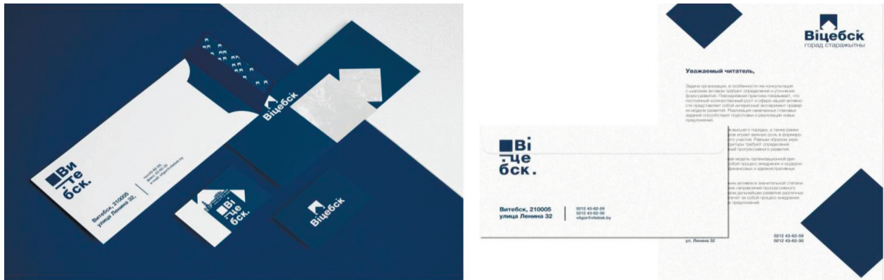
Рисунок 6 – Деловая документация

Также разработаны следующие элементы айдентики: деловая документация (бланк письма, конверт), листовки, сити-форматы, билборды, карта города и стикеры. Дизайн деловой документации для бренда Витебска сдержан и минималистичен. Конверт содержит логотип и графические элементы в виде стилизованного пантографа [8]. Помимо этого, на нем расположена нужная информация, такая как адрес, почтовый индекс, номера телефонов и e-mail (рис. 6).