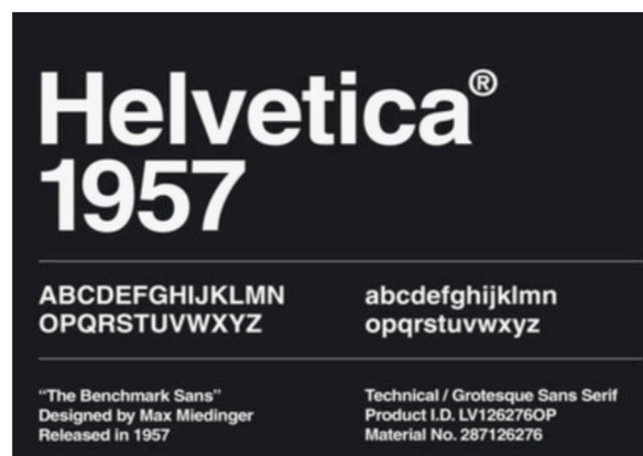
Рисунок 5 – Шрифт Helvetica

Шрифт был разработан так, чтобы не производить впечатление и не иметь никакого внутреннего значения. Благодаря этому его можно легко адаптировать к различным дизайн-проектам. Это одна из причин,