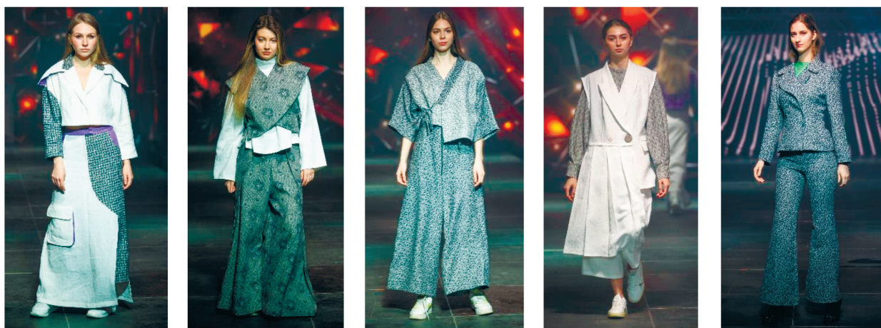
Рисунок 3 – Фрагмент коллекции «Альянс» бренда VSTU by Vitebsk State University of Technology

различного уровня. По результатам фестиваля студенты специальности «Дизайн костюма и тканей» награждены сертификатами «За развитие льняной отрасли и продвижение бренда «Белорусский лён» (рис. 3) [5].