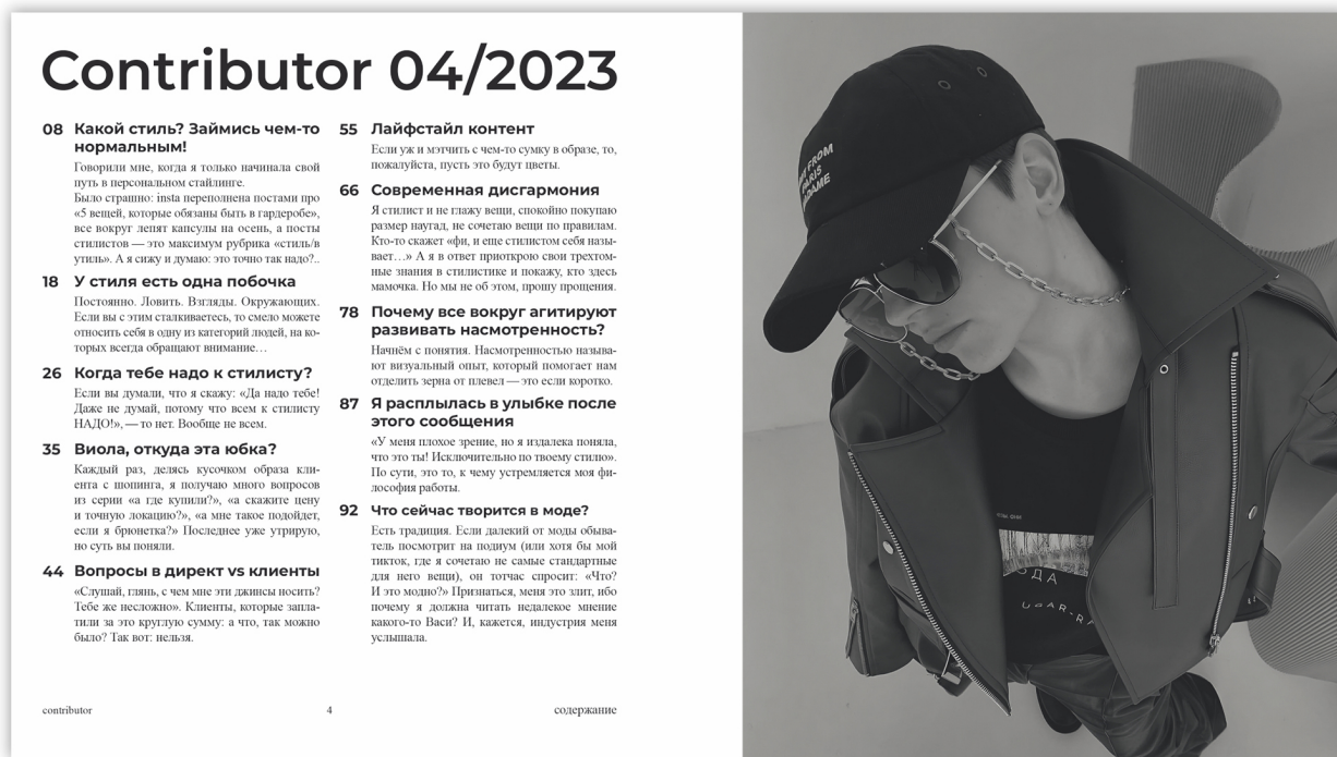
Рисунок 2 – Разворот журнала «Contributor»

журнального издания использованы фэшн-кадры стилиста и декоративные элементы. Использование черных линий разной высоты и ширины является графическим дополнением, придает разворотам журнала оригинальности. Пробная печать формата 190×340 мм. Плотность бумаги основных страниц – 120 г/м 2 , обложки – 350 г/м 2 (рис. 2).