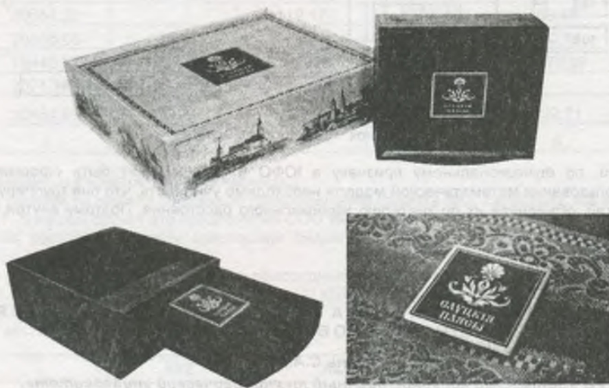
Рисунок 1 – Сувенирная упаковка для слуцких поясов

Данный проект может быть рекомендован к внедрению на Республиканском унитарном предприятии художественных изделий «Слуцкие пояса».