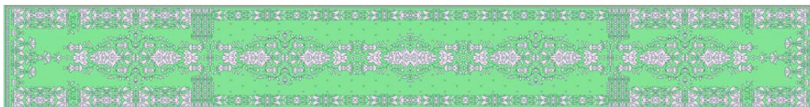
Рисунок 1 – Технический рисунок шелкового шарфа

середник (рис. 1). Шарф может стать частью как женского, так и мужского гардероба.